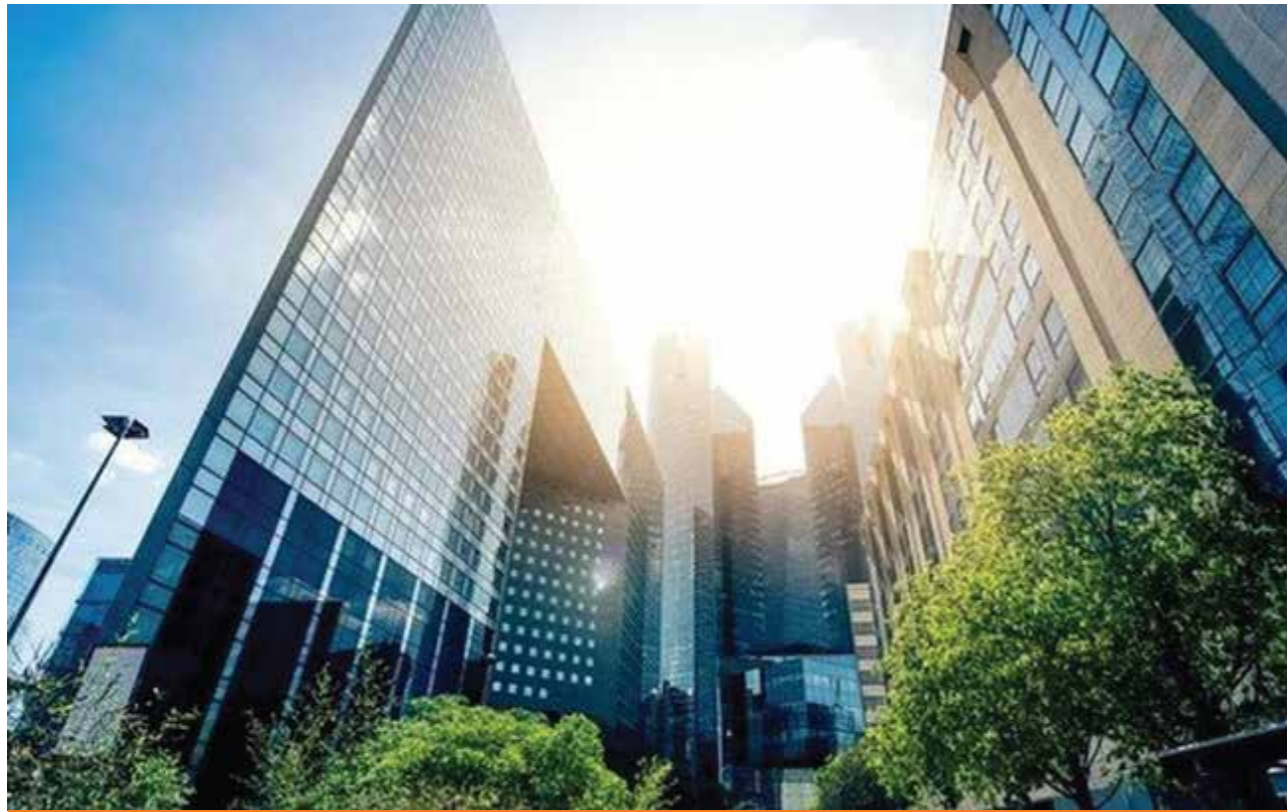
Đi qua một năm bất ổn, thị trường địa ốc đón loạt tin vui