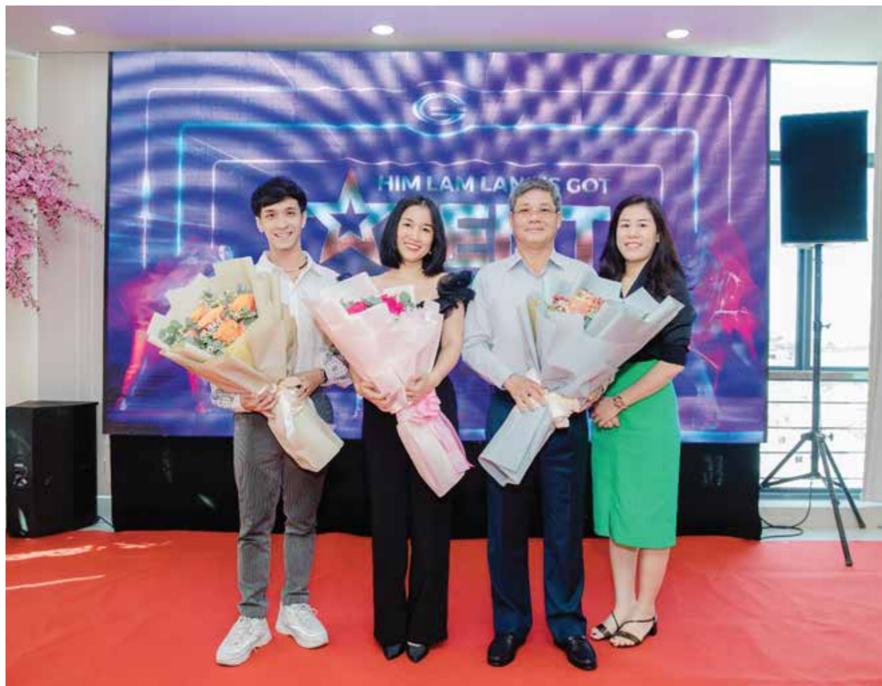
Ban giám khảo công tâm tìm ra những tiết mục xuất sắc nhất

và 1 kỷ niệm chương, 01 giải Á Quân trị giá 15.000.000 VNĐ và 1 kỷ niệm chương, 01 giải Quý Quân trị giá 10.000.000 VNĐ và 1 kỷ niệm chương, 02 giải Khuyến khích mỗi giải trị giá 5.000.000 VNĐ cùng rất nhiều Giải nỗ lực trị giá 1.000.000 VNĐ (dành cho tất cả các tiết mục có phần dàn dựng công phu còn lại).