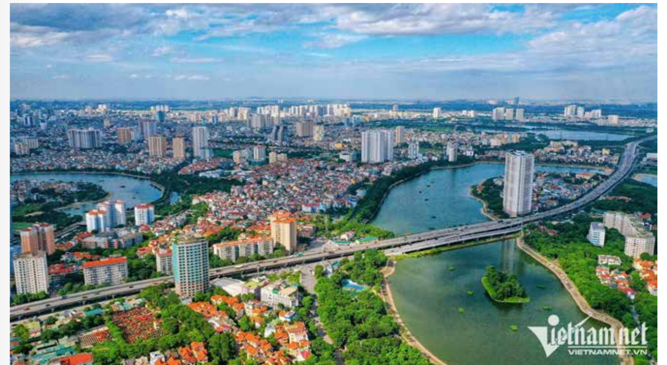
Theo chuyên gia, dòng vốn tín dụng bổ sung sẽ đi vào cuộc sống, sản xuất kinh doanh trong đó có bất động sản tương đối nhanh

Nhận định về thị trường bất động sản trong năm 2022, ông Lực cho rằng, có ba thách thức. Một là thị trường đang điều chỉnh rất mạnh sau hơn 2 năm tăng trưởng rất nóng. Hai là câu chuyện về pháp lý chưa được giải