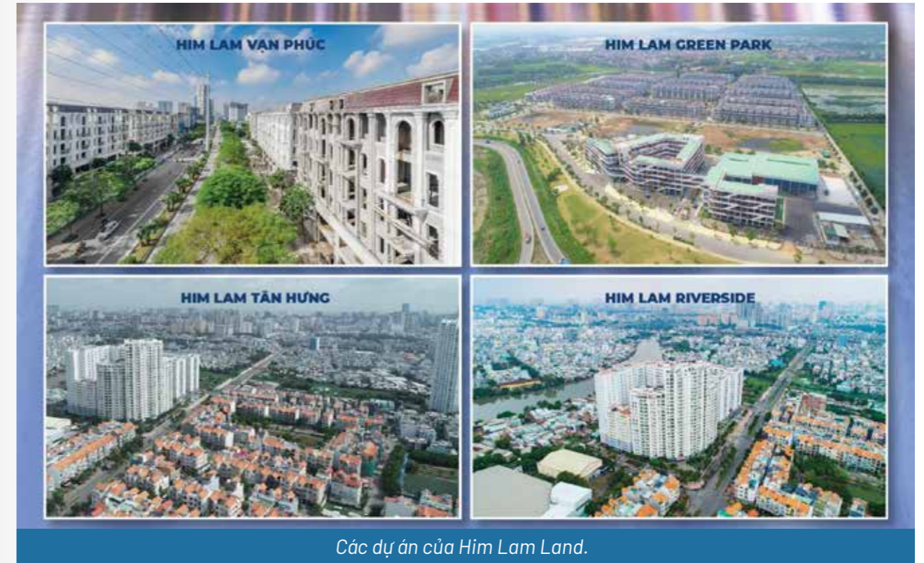
Các dự án của Him Lam Land.

Đặc biệt, các dự án do Him Lam Land đầu tư và phát triển luôn cam kết đảm bảo bàn giao đúng tiến độ cùng pháp lý minh bạch, sổ đỏ lâu dài. Mặc dù, chịu ảnh hưởng bởi dịch bệnh, Him Lam Land vẫn nỗ lực vượt bão Covid -19 hoàn thiện thi công và bàn giao cho cư dân.